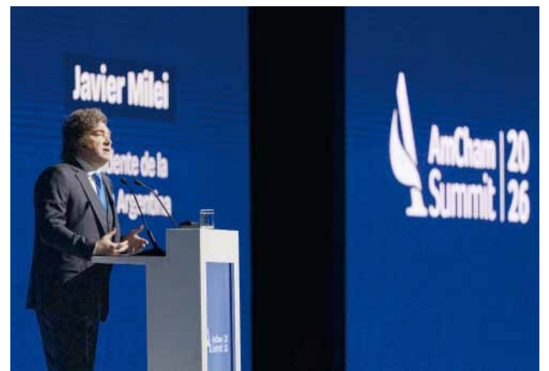
Mal dato. El presidente Javier Milei habló de inflación después de conocerse el índice.

Entre las divisiones que componen el índice, "Educación" fue la