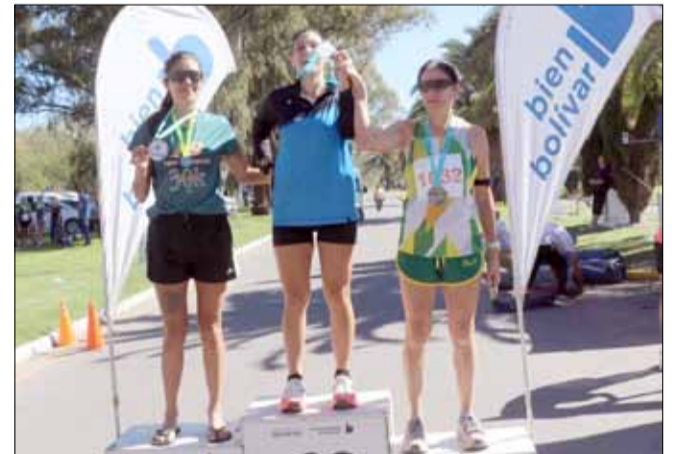
Podio de la general femenina..