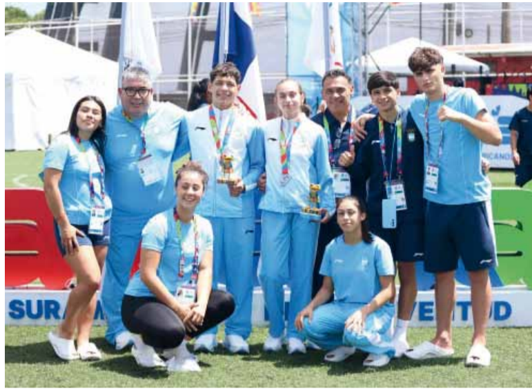
Talento. Los dueños de las preseas argentinas.