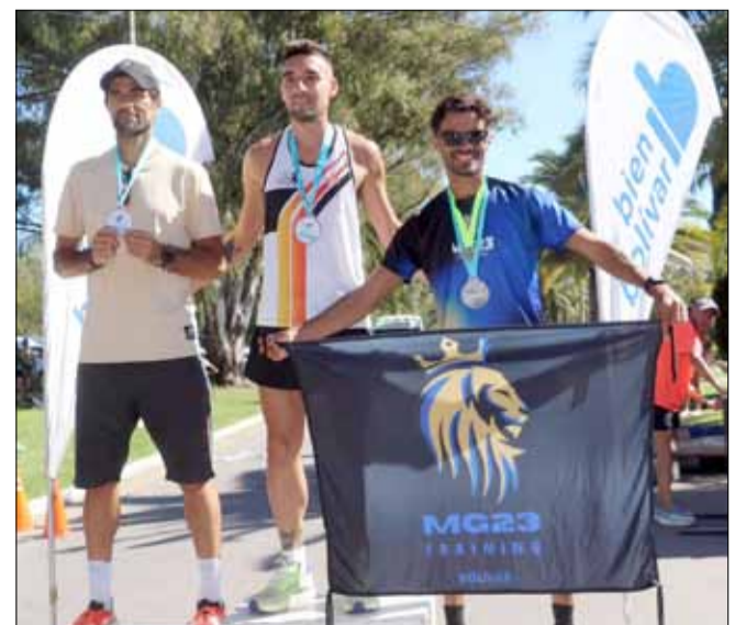
Podio de la general masculina.