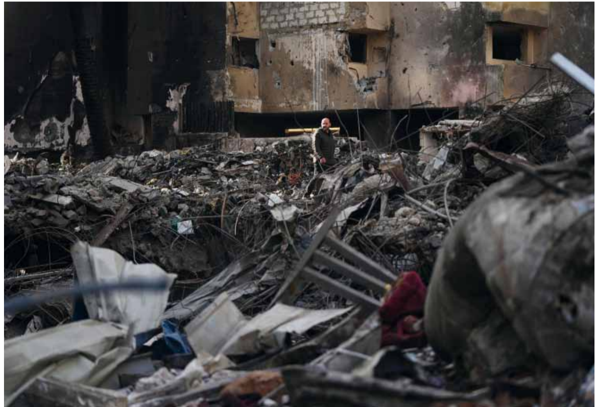
Sede. El líder republicano sugirió que Islamabad podría volver a ser el escenario de las conversaciones.

El estancamiento de las negociaciones iniciales generó preocupación sobre el futuro del proceso. El vicepresidente JD Vance señaló que el próximo paso depende ahora de Teherán, luego de que la delegación iraní regresara a su país para consultar con sus