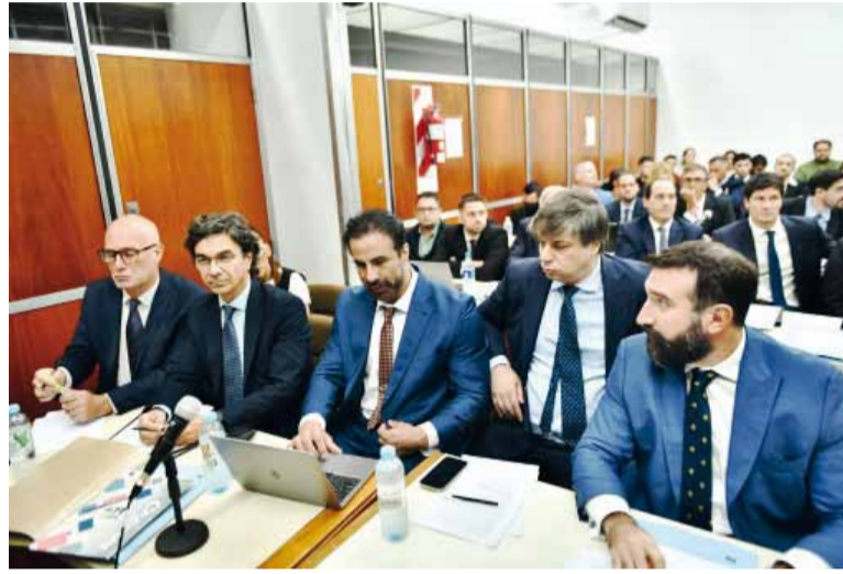
De nuevo. Comenzó el segundo juicio por la muerte de Diego Maradona en los Tribunales de San Isidro.