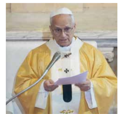
Visita. El Sumo Pontífice en Argelia.

"Pero el corazón de nuestro Padre no está con los malvados, con los prepotentes, con los soberbios; el corazón de Dios está con los pequeños y los humildes, y con ellos lleva adelante su Reino de amor y de paz, cada día".