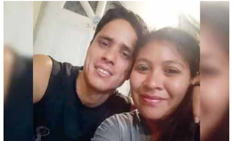
Riesgo de fuga. Para la Justicia los acusados por el crimen del niño podían además entorpecer la investigación.

"Ángel siempre ingresaba con una sonrisa al jardín y daba unos