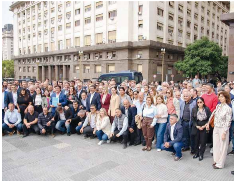
El reclamo. Los intendentes frente al Ministerio de Economía.

"El reclamo es federal, incluye a más de 150 intendentes de todo el país; no es una provincia, es todo el país. Exigimos al Gobierno nacional que baje el litro del combustible y que además hagan