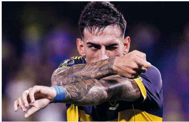
Letal. El defensor volvió a marcar de cabeza.

El complemento mantuvo un ritmo intenso y friccionado. Boca generó varias aproximaciones, con intentos de Merentiel y Ascacibar, siempre contenidos por