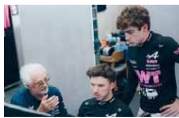
Equipo. Colapinto, junto a Briatore y Gasly.

De esta manera, entre medallas y triunfos colectivos, Argentina construye una participación sólida en Panamá, con jóvenes talentos que no solo suman resultados inmediatos, sino que también alimentan la proyección del deporte nacional a futuro.